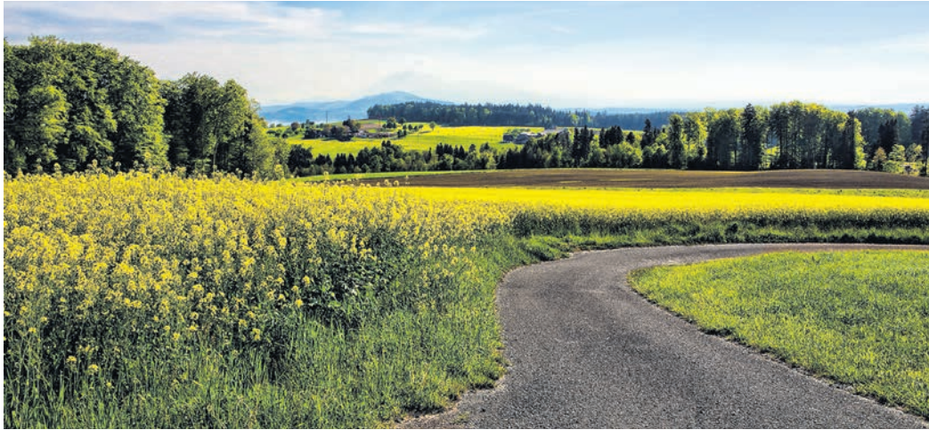
Ein Grossteil der rund 40 FDP-Vorstösse zum Thema «Umwelt und Klima» hat im Parlament Mehrheiten gefunden.

Wir haben die Verantwortung, den kommenden Generationen eine intakte Lebensgrundlage zu hinterlassen. Mit dieser Überzeugung hat die FDP zusammen mit ihren Delegierten im Juni 2019 eine griffige, freisinnige Umwelt- und Klimapolitik beschlossen. Dieses Versprechen lösen wir Schritt für Schritt ein.