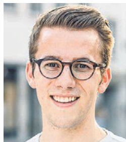
Andri Silberschmidt, Nationalrat (ZH) und Beisitzer (neu)

«Ich glaube, es ist wichtig, die Sensibilität der italienischsprachigen Schweiz in die nationale Realität einzubringen. Im Bewusstsein, dass es nicht nur darum geht, Haltungen durchzusetzen, sondern vielmehr darum, in einem föderalistischen Geist, in dem die Besonderheiten der verschiedenen Regionen anerkannt werden, eine zukunftsorientierte Schweiz zu schaffen.»