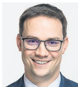
Alex Farinelli, Nationalrat (TI) und Beisitzer (neu)