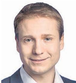
Philippe Nantermod, Nationalrat (VS) und Vizepräsident FDP.Die Liberalen (bisher)

«Liberalismus ist langfristig ein Erfolgsrezept, kurzfristig aber anstrengend. Ich bin äusserst motiviert, diesen Einsatz zu leisten und weiterhin täglich für unsere liberale Ordnung zu kämpfen. Dies mit dem tollen Team, das wir in der FDP von der Basis bis zur Parteileitung bilden.»