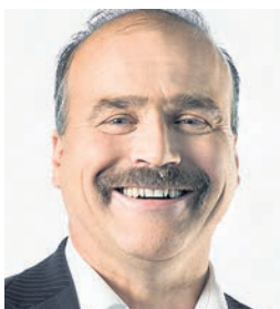
Philippe Bauer, Ständerat (NE) und Beisitzer (neu)

«Ich bin überzeugt, dass die Schweizer Bevölkerung auf eine politische Partei setzt, die sich für Eigenverantwortung und Freiheit einsetzt. Durch meine tägliche Arbeit und in Zusammenarbeit mit allen freisinnigen Akteuren im Land möchte ich an unserem zukünftigen Erfolg teilhaben.»