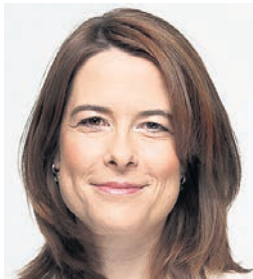
Petra Gössi, Nationalrätin (SZ) und Präsidentin FDP.Die Liberalen (bisher)

Die Delegierten haben Petra Gössi mit 267 von 283 abgegebenen Stimmen sehr deutlich wiedergewählt. Auch die anderen Kandidierenden wurden klar gewählt. Die FDP gratuliert ihnen herzlich zur Wahl und freut sich auf die Zusammenarbeit. Der Vorstand ist nun folgendermassen zusammengesetzt: