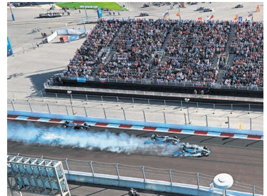
Aus Schweizer Produktion: Schutzzäune für die Formel 1.