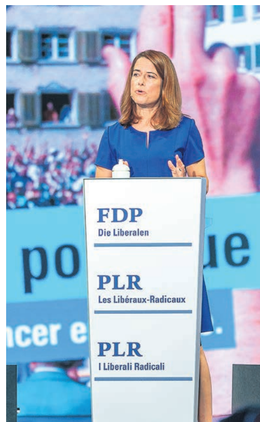
«Politik ist kein Selbstzweck», steht im Hintergrund bei der Rede von Petra Gössi am Tag der FDP 2019. Mit der Enkelstrategie nimmt die FDP wichtige Fragen der Zukunft auf.

Gerade nachdem alle grösseren Parteianlässe abgesagt werden mussten und so der soziale und politische Austausch erschwert wurde, liegt es mir am Herzen, mittels dieser Mitgliederumfrage wieder mit Ihnen in Kontakt zu treten. Mit der Umfrage wollen wir ein breites Stimmungsbild innerhalb der FDP abholen – das ist gerade deshalb wichtig, weil wir über Fragen diskutieren, die mehrere Generationen betreffen. Nun sind die Zugangsdaten für die Umfrage auf dem Weg zu Ihnen – in wenigen Tagen erhalten Sie Post von uns, und Sie können loslegen!