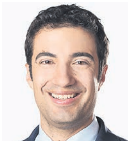
Andrea Caroni, Ständerat (AR) und Vizepräsident FDP.Die Liberalen (bisher)

«Wir haben viel Arbeit vor uns. Die nächsten Jahre werden anspruchsvoll. Wir müssen an unseren Inhalten und unseren Strukturen arbeiten. Wir müssen kämpferischer werden. Ich weiss: Das liegt uns nicht per se im Blut als diejenige Partei, die die Schweiz und ihre Institutionen geschaffen hat. Aber ich bin bereit dazu.»