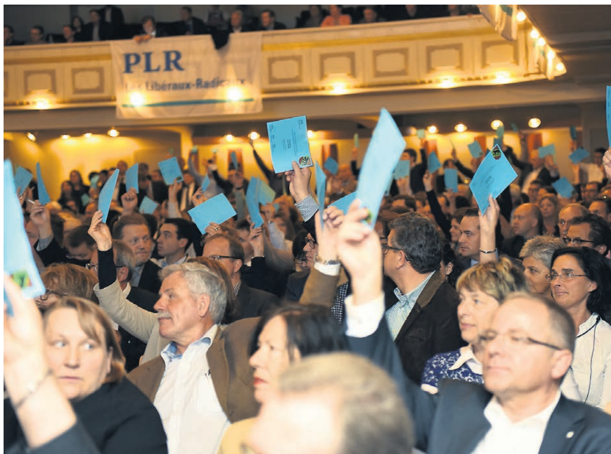
Volles Haus im National in Bern.

Auch die Vizepräsidenten Isabelle Moret, Vincenzo Pedrazzini und Carla Speziali wurden von den Delegierten feierlich verabschiedet. Anschliessend kam es zur Neubesetzung des Parteivorstands. Als Präsidentschaftskandidatin betonte die Schwyzer Nationalrätin Petra Gössi die Wichtigkeit von Freiheit und Eigenverantwortung: Es seien die Werte, welche ihre Präsidentschaft mitprägen werden. Die Delegierten hegten keinen Zweifel an ihrer Kompetenz und wählten sie einstimmig zur neuen Präsidentin der FDP.Die Liberalen Schweiz. Ebenfalls einstimmig gewählt wurden die Vize-