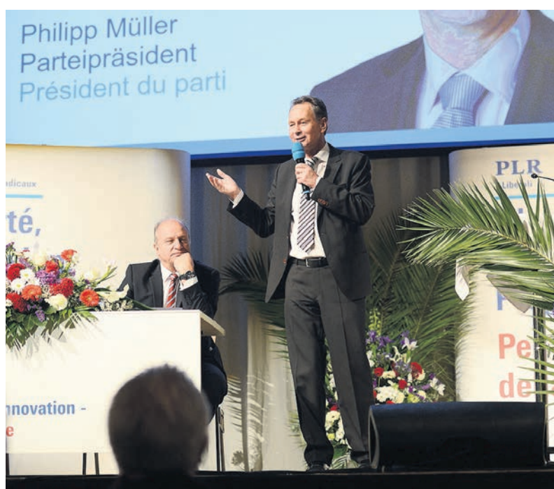
... und bei seinem letzten Auftritt als amtierender Präsident.