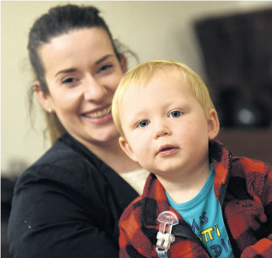
Keiner zu klein, dabei zu sein!