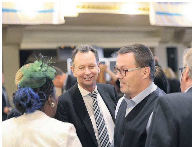
Philipp Müller im Gespräch mit Delegierten ...

niemand. Dies wurde auch in der medialen Berichterstattung in den Tagen nach seiner Wahl hervorgehoben. Das «St. Galler Tagblatt» etwa verortete in ihm «den Optimismus des Chrampfers», wie man ihn gerade unter KMU-Vertretern fände. Die NZZ wiederum schrieb nüchtern, auf den feinsinnigen Analytiker folge «eine kommunikative Saftwurzel», unter deren Führung der FDP ein Comeback zuzutrauen sei. Dennoch war manchen ein gelernter Handwerker an der Spitze einer bis anhin von Präsidentinnen und Präsidenten mit akademischem Hintergrund geführten FDP wenn auch nicht suspekt, doch zumindest gewöhnungsbedürftig. Schnell waren jedoch die anfänglichen Vorbehalte verflogen als klar wurde, dass Philipp Müller, neben vielen anderen Qualitäten, eine Eigenschaft mitbringt, die sich später als Teil des neugefundenen Erfolges der Freisinnig-Liberalen herausstellen sollte: die Nähe zur Basis.