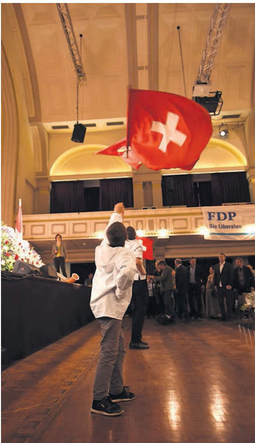
Schwyzer Fahenschwinger ...