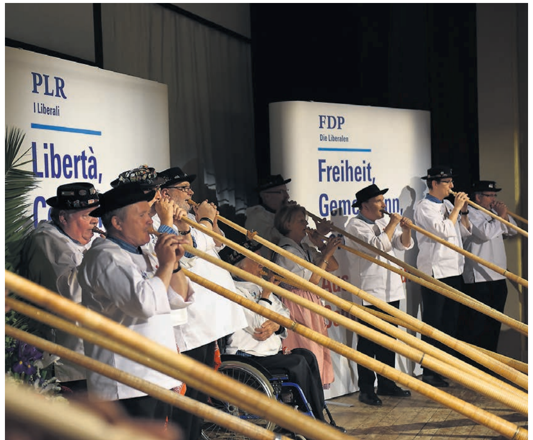
... und Alphornbläser.