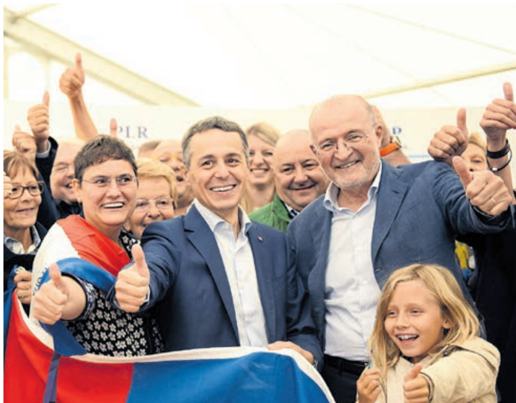
«Liberale Werte sind aktuell wie eh und je»: Fulvio Pelli (rechts) mit Bundesrat Ignazio Cassis (Mitte).