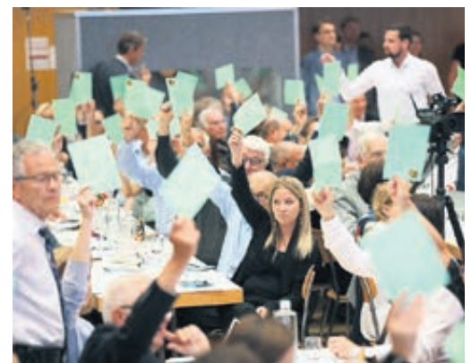
Die Delegierten der FDP sprachen sich klar und deutlich gegen die SBI aus.

Gegen Ende der Versammlung beschliessen die Delegierten die Parolen für die nächsten Abstimmungsvorlagen vom 25. November 2018. Sie sprachen sich mit überwältigender Mehrheit gegen die populistische Selbstbestimmungs-Initiative aus. Zudem unterstützten sie klar die Änderung des Bundesgesetzes über den Allgemeinen Teil des Sozialversicherungsrechts (ATSG). Die Änderung ermöglicht eine schärfere Bekämpfung von Versicherungsbetrug.