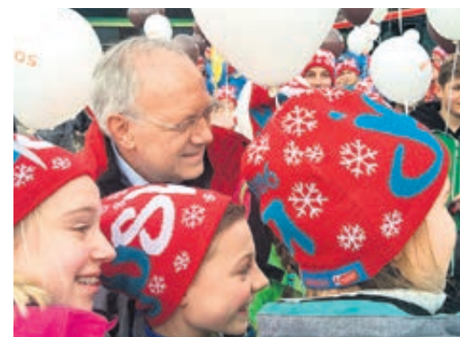
Beste Bildungsmöglichkeiten für die zukünftigen Generationen liegen Johann Schneider-Ammann besonders am Herzen.

• Fürsprecher für die gelebte Sozialpartnerschaft: Verfechter des Dialogs zwischen Arbeitge-