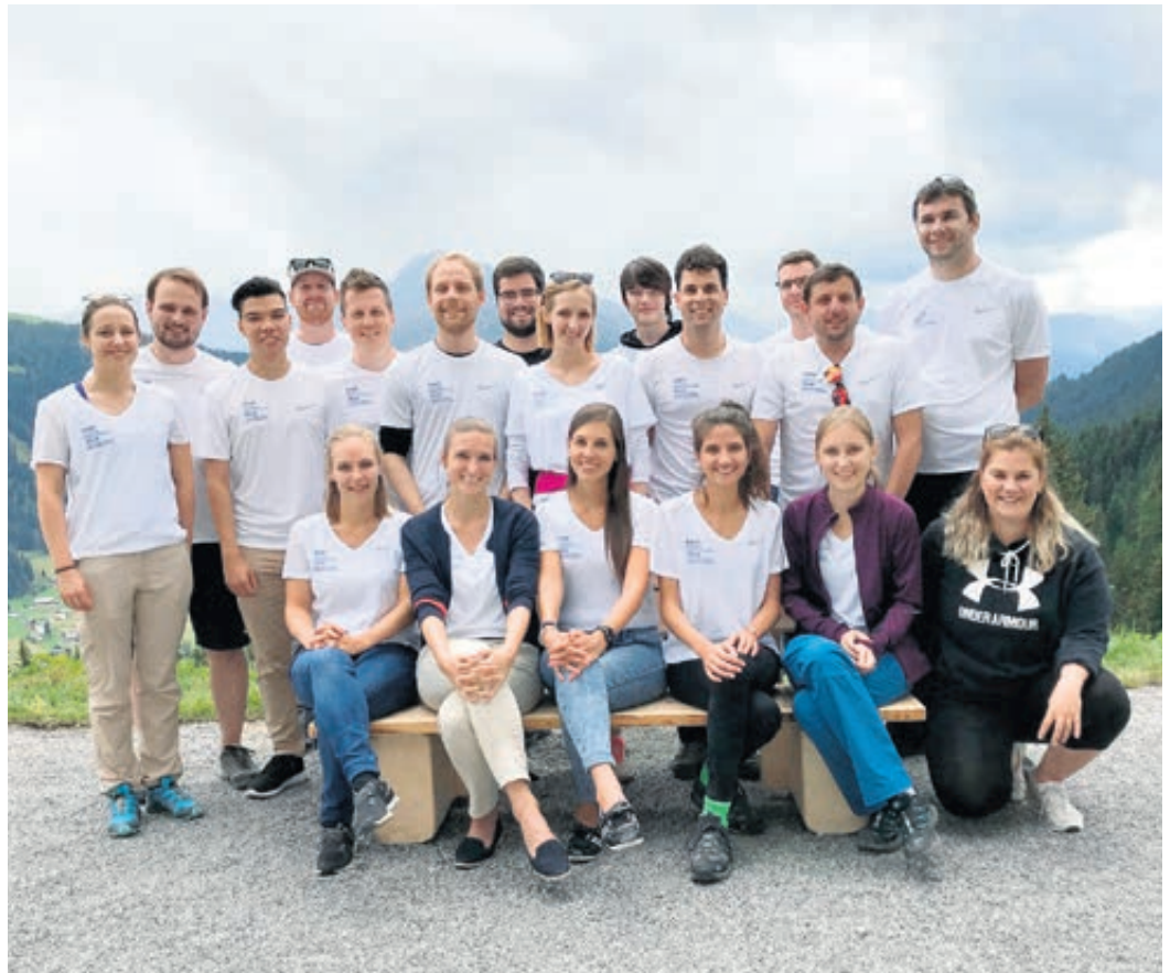
Werden Sie Teil des FDP-Wahlkampfteams und engagieren Sie sich an vorderster Front!

Teilnahme begrenzt, ca. 300 Plätze verfügbar