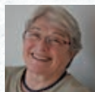
Bea Wyler erste Frau Rabbiner in der Schweiz