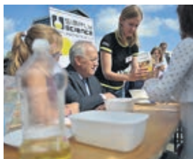
Bildungsminister Schneider-Ammann beim chemischen Experiment mit den Jüngsten.