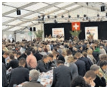
Das Festzelt war mit über 1200 Freisinnigen fast bis auf den letzten Platz gefüllt.