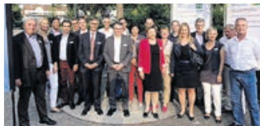
Die Kandidaten der FDP Stadt Zug für den Kantonsrat, den Grossen Gemeinderat und den Stadtrat.

Was waren die Kernelemente des Wahlkampfes? Zunächst sind die ausgezeichneten Kandidaten zu nennen. Wir sind überzeugt, dass unsere Leute den besten Rucksack mitbringen. Bewusst präsentierten wir die Kandidaten auch über die Gemeindegrenzen hinaus – denn die FDP verfügt über