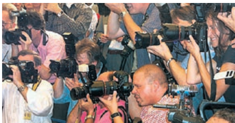
Keine mediale Vorverurteilung: In jedem Prozess muss die Unschuldsvermutung gelten.

Auf diesen Daten, welche als Grundlage für den Gutachter des Staatsanwaltes dienten, basierte später hauptsächlich die Verurteilung. Unzulässig war auch, dass das Gericht den Fall Schmidheiny ex post betrachtete. Sie verurteilten ihn wegen Unterlassung, obwohl aufgrund des damaligen Wissensstandes und eines fehlenden Asbestverbots in Italien für Schmidheiny nicht abschätzbar war, dass diese Unterlassung zu einem späteren Zeitpunkt eine Strafbarkeit begründen würde. Jetzt bleibt zu hoffen, dass das italienische Kassationsgericht hier doch noch auf den rechten Weg des Rechts kommt. Ansonsten müsste dieser Fall als deutliche Warnung für das Schweizer Engagement in Ausland gesehen werden.