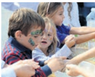
Die jüngsten Freisinnigen versuchten sich am SimpleScience-Stand.