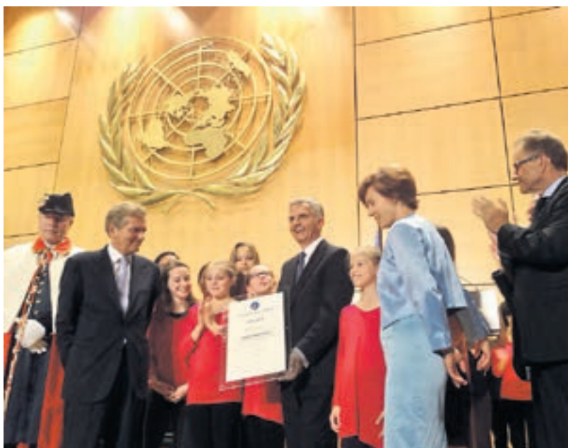
Feierlicher Moment: Didier Burkhalter mit dem Prix de la Fondation pour Genève.

Auch habe er der internationalen Rolle der Schweiz durch Genf selber neue Impulse gegeben und die Stadt und das Land dadurch sowohl aktiv als auch passiv im international sehr kompetitiven Kontext besser positioniert. «Seine Politik der Öffnung, des Dialogs und der Zusammenarbeit in Übereinstimmung mit der Neutralität und der humanitären Tradition unseres Landes kann nur eine weitere Stärkung der Rolle der Schweiz und Genfs, Stadt des Friedens und der internationalen Zusammenarbeit, zur Folge haben», lobte ihn die Fondation pour Genève.