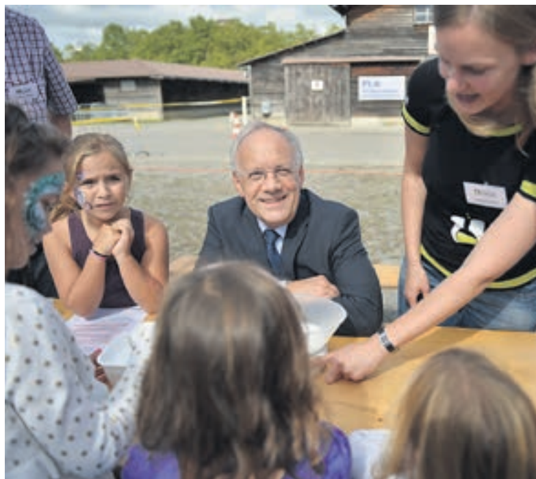
Voller Einsatz für den Fachkräfte-Nachwuchs: Bildungsminister Schneider-Ammann am SimpleScience-Stand am Tag der FDP.

Ich danke den Unternehmerinnen und Unternehmern und auch unserer FDP, dass sie sich für eine starke Berufsbildung einsetzen.