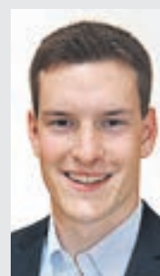
Jugend auf dem Vormarsch: 23-jähriger Gemeinderat für Münsterlingen

Und dann ist da noch das Zeitproblem: Arbeit plus Ortsparteipräsidentin plus Vorstand FDP Frauen Thurgau – wo sie auch mit Abstand die Jüngste ist –, da bleibt oft nicht mehr viel übrig von der Freizeit. Aber wer weiss: Wenn es in diesem Tempo weitergeht, steht einer erfolgreichen Politikkarriere eigentlich nichts im Weg.