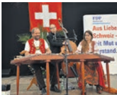
Das Trio Anderscht sorgte für die musikalische Unterhaltung am Tag der FDP.