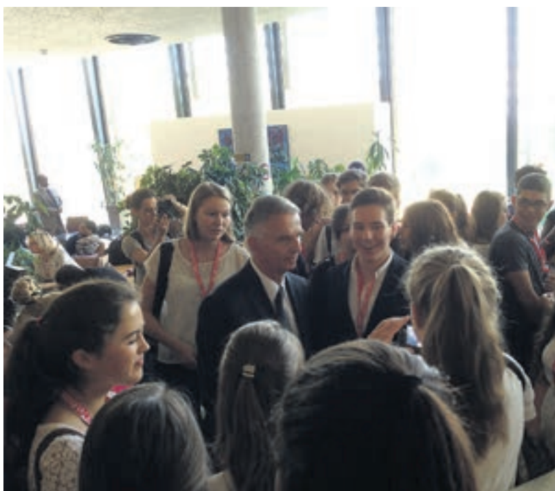
Bad in der Menge: Persönliche Begegnung des Bundespräsidenten mit Schweizer Schülerinnen und Schülern im Palais des Nations.

UN-Generalsekretär Ban Ki-moon übermittelte in einer Videoaufnahme seine herzliche Gratulation aus New York. «Präsident Burkhalter verteidigt die folgenden Werte immerzu: Friede, Menschenrechte und menschliche Entwicklung. Ich zähle Präsident Burkhalter zu meinen persönlichen Freunden und bewundere sein Engagement für das Gemeinwohl.» Ban fügte hinzu: «Die Vereinten Nationen und Präsident Burkhalter teilen die Vision einer Welt, in der alle Menschen in Frieden und mit Würde leben können.»