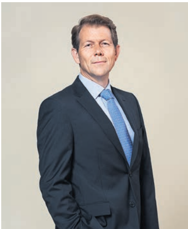
Fritz Zurbrugg: «Auch künftig sollen Unabhängigkeit, Flexibilität und Handlungsfähigkeit der Nationalbank sicher gestellt sein.»

Eine grundlegende Voraussetzung für die Erfüllung unseres gesetzlichen Mandats ist die Handlungsfreiheit betreffend des Einsatzes der nötigen geldpolitischen Instrumente. Da sich geldpolitische Operationen direkt auf die Bilanz der Nationalbank auswir-