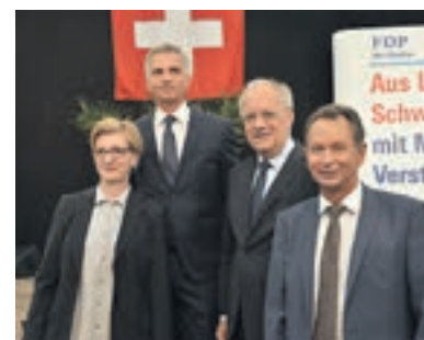
Fraktionspräsidentin Gabi Huber mit den Bundesräten und Parteipräsident Philipp Müller.