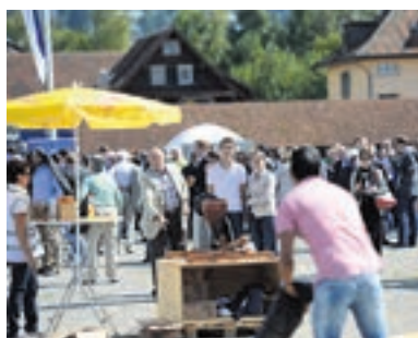
An der «Mohrenkopf-Schleuder» versuchten sich Jung und Alt mit süßem Gewinn.