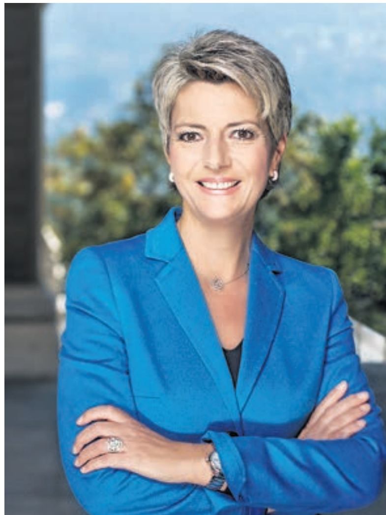
«Die Welt ist im Wandel – unsere Neutralitätspolitik wandelt sich mit ihr.»

Vor dem Hintergrund dieser Entwicklungen habe ich eine Interpellation