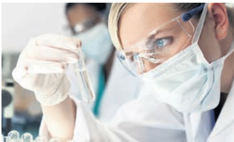
Trägt Social Freezing zur Gleichberechtigung bei?

Was ist von diesem «Social Freezing» zu halten? Sorgen diese Firmen dafür, dass Frauen endlich nicht mehr zwischen Kind und Karriere entscheiden müssen? Tragen sie so zur Gleichberechtigung bei? Was auf den ersten Blick nach Wohltat aussieht, ist nur die halbe Wahrheit. Denn das Problem