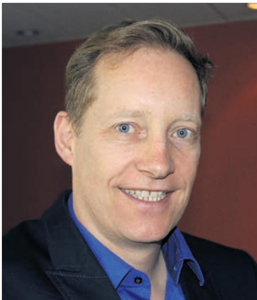
«Das Auslandschweizergesetz führt zu mehr Übersichtlichkeit und weniger staatlichen Vorschriften – ganz im Sinne des Freisinns», sagt FDP International Präsident François Baur.

Das Gesetz hält ausdrücklich fest, dass Schweizerinnen und Schweizer, die ins Ausland reisen, dies in «Eigenverantwortung» tun. Durch die Schaffung eines «Guichet Unique», wird eine einzige, für die Anliegen der Auslandschweizerinnen und -schweizer zuständige Anlaufstelle geschaffen. Richtig war auch die Wahl des EDA als verantwortliches Departement, ist es doch schon für die konsularischen Dienste im Ausland zuständig.