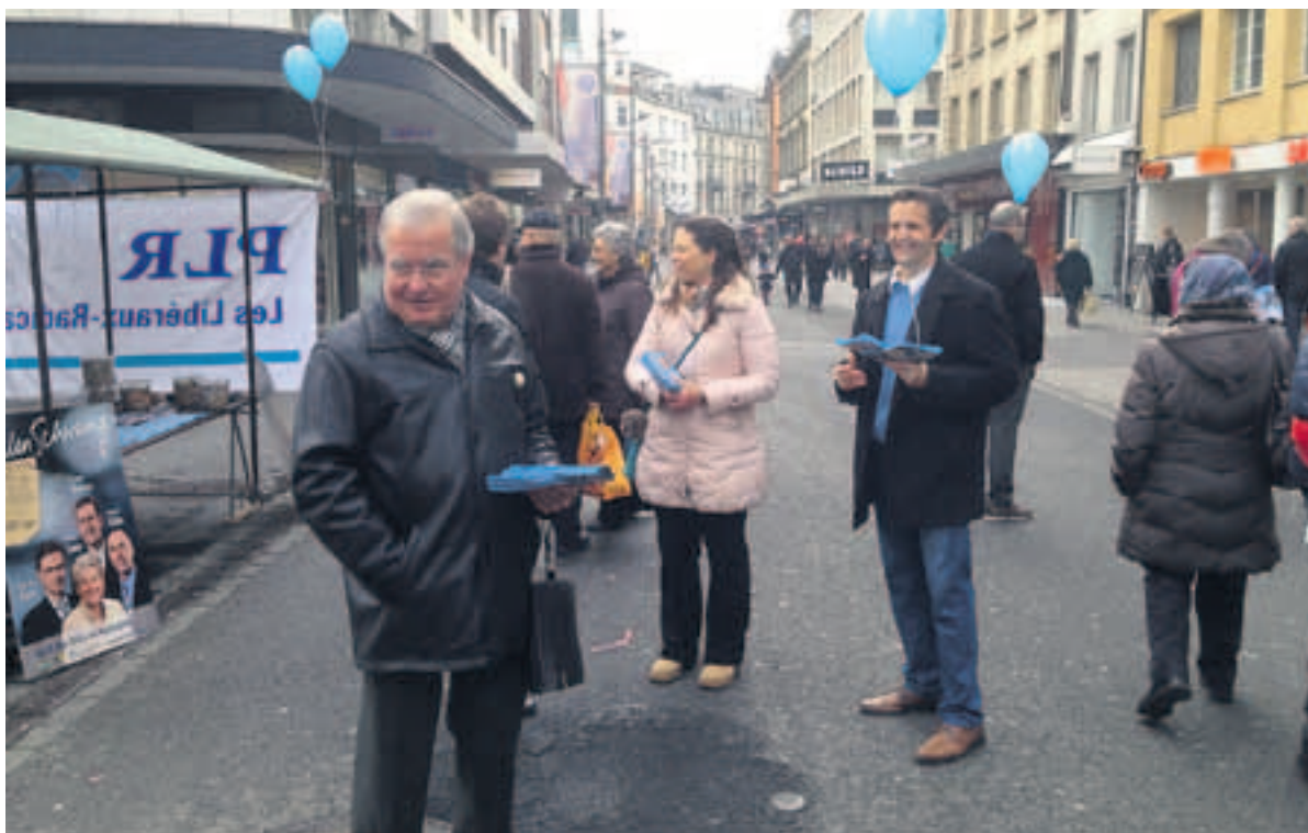
Die Kandidierenden der Berner FDP waren fleissig auf den Strassen unterwegs, um die Wählenden zu überzeugen.

Nichtsdestotrotz zeigen die Verluste der BDP, dass eine klare Positionierung von den Wählerinnen und Wählern geschätzt wird.