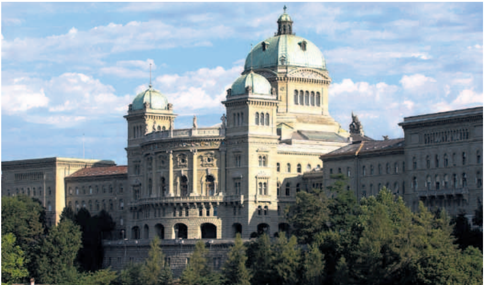
Damit die Schweiz weiter im Licht des Erfolges steht, braucht es eine klare Strategie für die Zukunft.

■ Die Welt – und die Schweiz – werden «kleiner»: Internet und Ver-