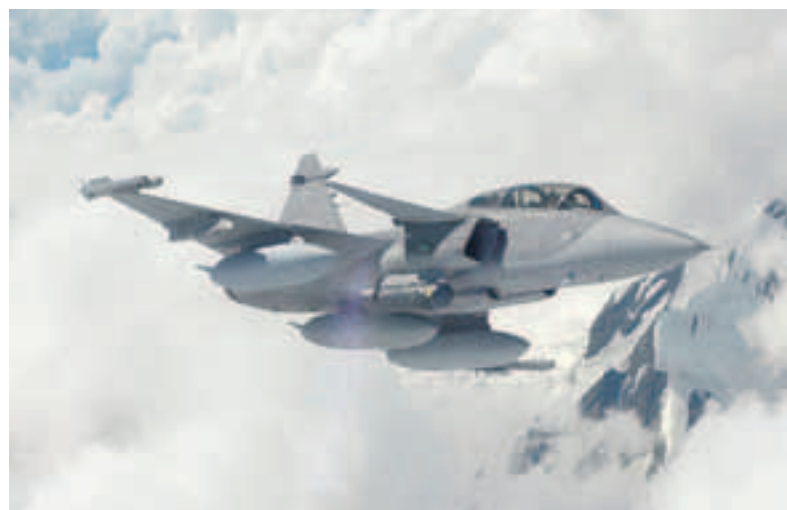
Mit dem Gripen E können auch bei schlechtem Wetter und in der Nacht Einsätze geflogen werden.

Den Urhebern des Referendums geht es nicht um die neuen Kampfjets, sondern einmal mehr darum, die Existenz der Schweizer Armee in Frage zu stellen. Die SP hat die Abschaffung der Armee ja in ihrem Parteiprogramm, die Gruppe Schweiz ohne