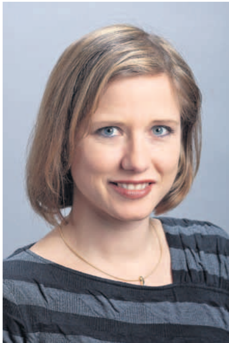
«Der Schutz von Kindern ist unser aller Anliegen. Der harte, aber korrekte Gegenvorschlag ist besser geeignet als die Initiative», sagt Nationalrätin Christa Markwalder.

Wir stehen ein für den Rechtsstaat. Eine seiner tragenden Säulen ist das Prinzip der Verhältnismässigkeit. Jeder Mensch – sogar ein Straftäter – hat Anspruch darauf, dass nur angemessene, nicht drakonische Sanktionen gegen ihn ergriffen werden. Wer innerorts 20 km/h zu schnell fährt, gefährdet Kinder, wird bestraft und verliert temporär den Fahrausweis. Sein Auto wird nicht gleich verschrottet und der Fahrausweis nicht lebenslang entzogen. Das ist unser Rechtsstaat. Daher haben die FDP-Delegierten deutlich die Nein-Parole zu dieser unnötigen, unvollständigen und unverhältnismässigen Initiative beschlossen.