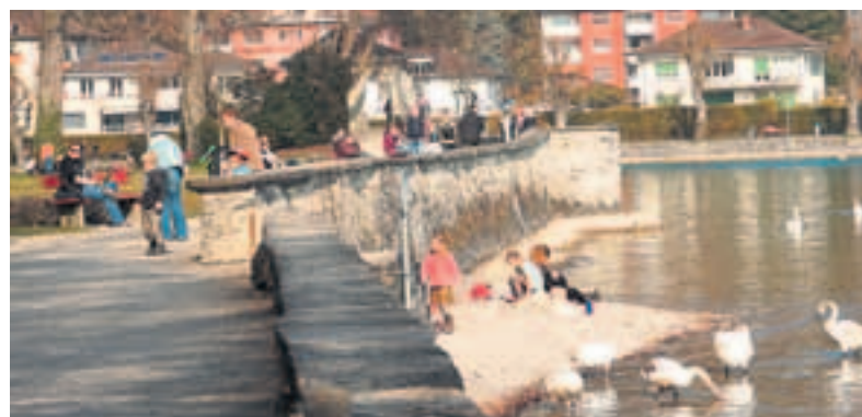
Mehr Gemeinsinn bedeutet für die FDP, Raum zum Zusammenkommen zu schaffen, gemeinsam die Lebensqualität in der Schweiz zu verbessern.

Woche 23: 2. Juni bis 8. Juni Familien- & Gesellschaftspolitik