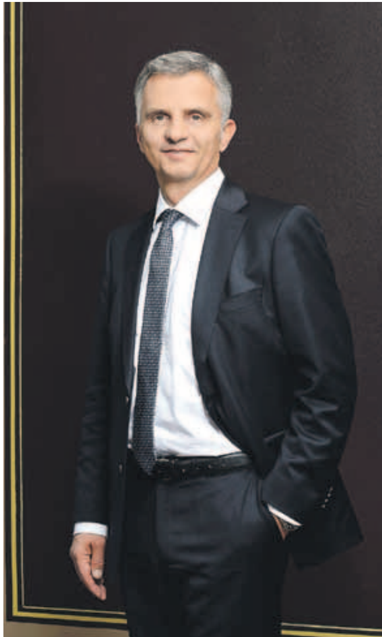
«Zusammenhalt, Ruhe und Klarheit sind entscheidend, um eine gute Lösung zu finden», sagt Bundespräsident Didier Burkhalter.

Die Umsetzung der Masseneinwanderungsinitiative zeigt exemplarisch, wie stark Innen- und Aussenpolitik zusammenhängen und sich gegenseitig beeinflussen. Um dabei Kohärenz und Glaubwürdigkeit zu wahren, ist es zentral, sowohl im In- als auch im Ausland die gleiche Botschaft zu vermitteln. In dieser Situation sind für unser Land Zusammenhalt, Ruhe und Klarheit entscheidend: Diese drei