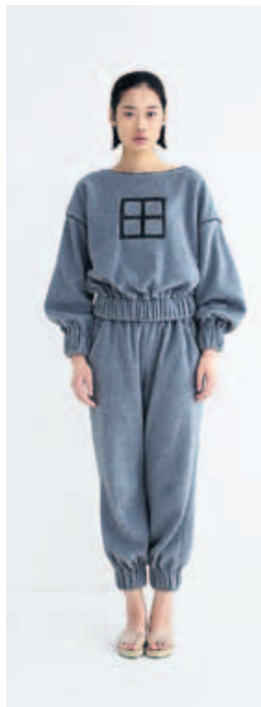
«Wir wollen Biomode schaffen, die nach Mode aussieht», Ziel der Firma NEEMIC.

Ansätze. Die meisten meiner chinesischen Freunde sehen das auch so, verhalten sich aber apolitisch, schlucken diesen Zustand, wie er ist. Stattdessen frönen sie dem Materialismus. Nicht ohne Ironie stellt man fest, dass hippe Atemschutzmasken in Peking der Renner sind.